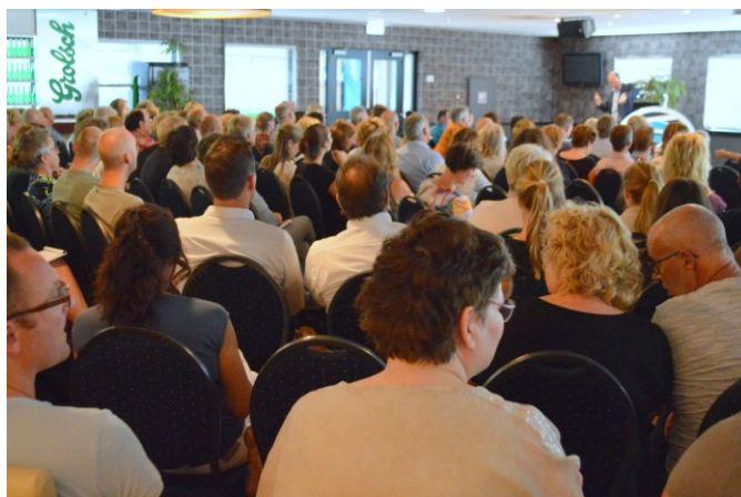
Het was 30 augustus een 'volle bak' in de Vijverberg.

Om een zuivere procedure te garanderen is Negometrix namelijk het enige kanaal waar vragen en antwoorden te vinden zijn. Op die manier krijgt iedere aanbieder dezelfde informatie.