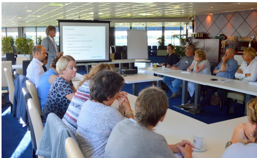
De 'beginnersworkshop' over Vecozo.

I-Sociaal Domein adviseert gemeenten en aanbieders daarover. De acht Achterhoekse gemeenten hebben ervoor gekozen het berichtenverkeer in deze aanbesteding via Vecozo/Ggk verplicht te stellen. Zorgaanbieders hadden al Vecozo (Veilige Communicatie in de Zorg), gemeenten hadden tot voor kort nog niets. Voor de gemeenten is nu het Gemeentelijk Gegevens Knooppunt (Ggk) ingericht. Deze twee knooppunten krijgen een verbinding met elkaar waardoor zorgaanbieders en gemeenten op een gestructureerde wijze contact hebben.